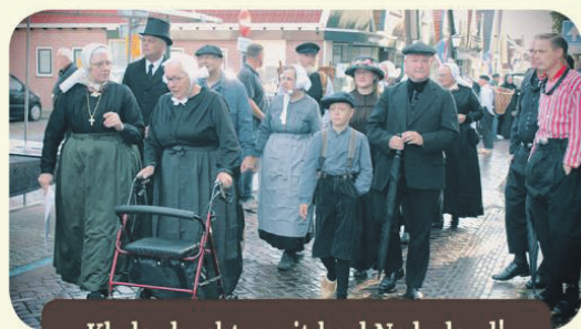
Klederdrachten uit heel Nederland!