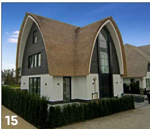
Vrijstaande woning met tweezijdige dakoriëntatie (boogdak)