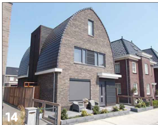
Vrijstaande woning met haakse dakoriëntatie (boogdak)