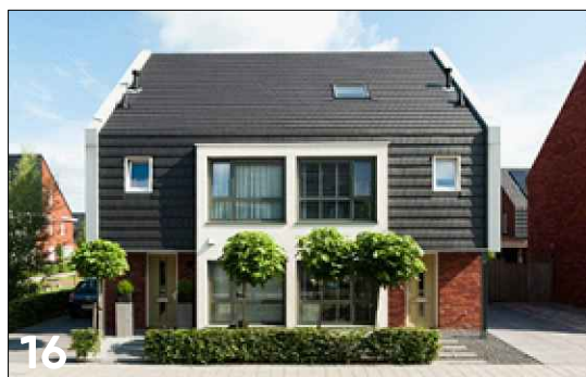
Twee-onder-een-kap met een langskap (mansardedak)