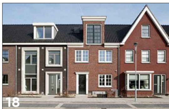
Rijwoningen met een langskap (zadeldaken) en ondergeschikte gevel opbouwen