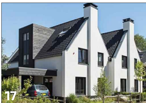
Twee-onder-een-kap woning met een haakse dakoriëntatie (tweeling woningen met zadeldak)